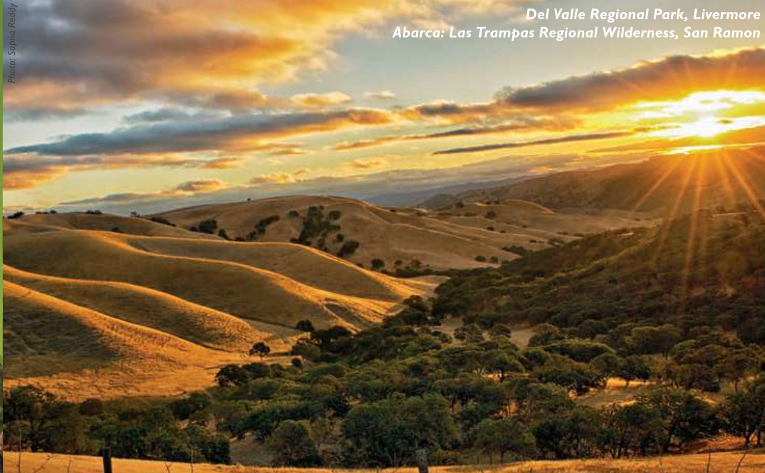
Del Valle Regional Park, Livermore Abarca: Las Trampas Regional Wilderness, San Ramon