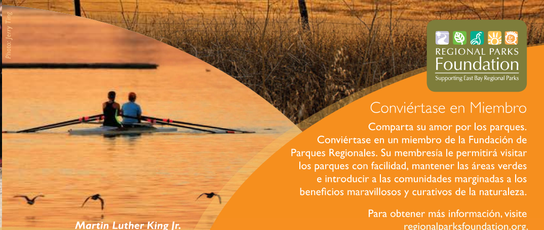
Martin Luther King Jr. Regional Shoreline, Oakland