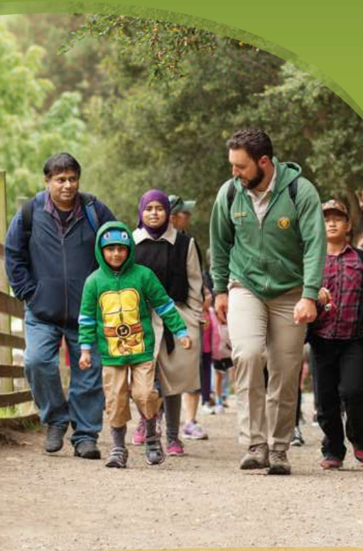
Tilden Nature Area, Berkeley